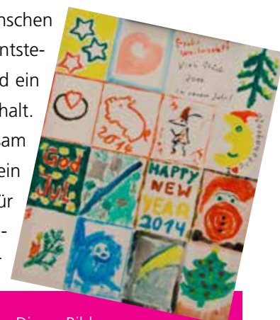
Dieses Bild wurde versteigert

Die Nachbarschaft des Putzhagens, zu denen auch Bewohner der angrenzenden Herzebrocker Straße gehören, freut sich außerdem über einen wunderbaren Nebeneffekt der Aktion: »Durch unsere Aktionen bringen wir die sehr unterschiedlichen Menschen hier enger zusammen. Es entstehen neue Freundschaften und ein unbeschreiblicher Zusammenhalt. Dass wir nun auch gemeinsam etwas Gutes tun können, ist ein weiterer wichtiger Schritt für ein harmonisches Miteinander. Hoffentlich macht unser Beispiel Schule!«