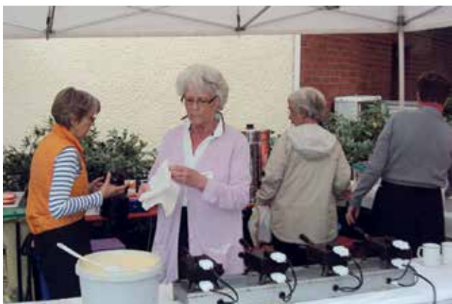
Auch als Waffelbäckerinnen ist das »Jacke-wie-Hose-Team« unschlagbar und von Festen nicht wegzudenken