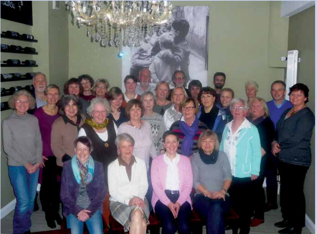
Neujahrsbrunch 2015: Der Kinderschutzbund hat viele (ehrenamtliche) Gesichter...