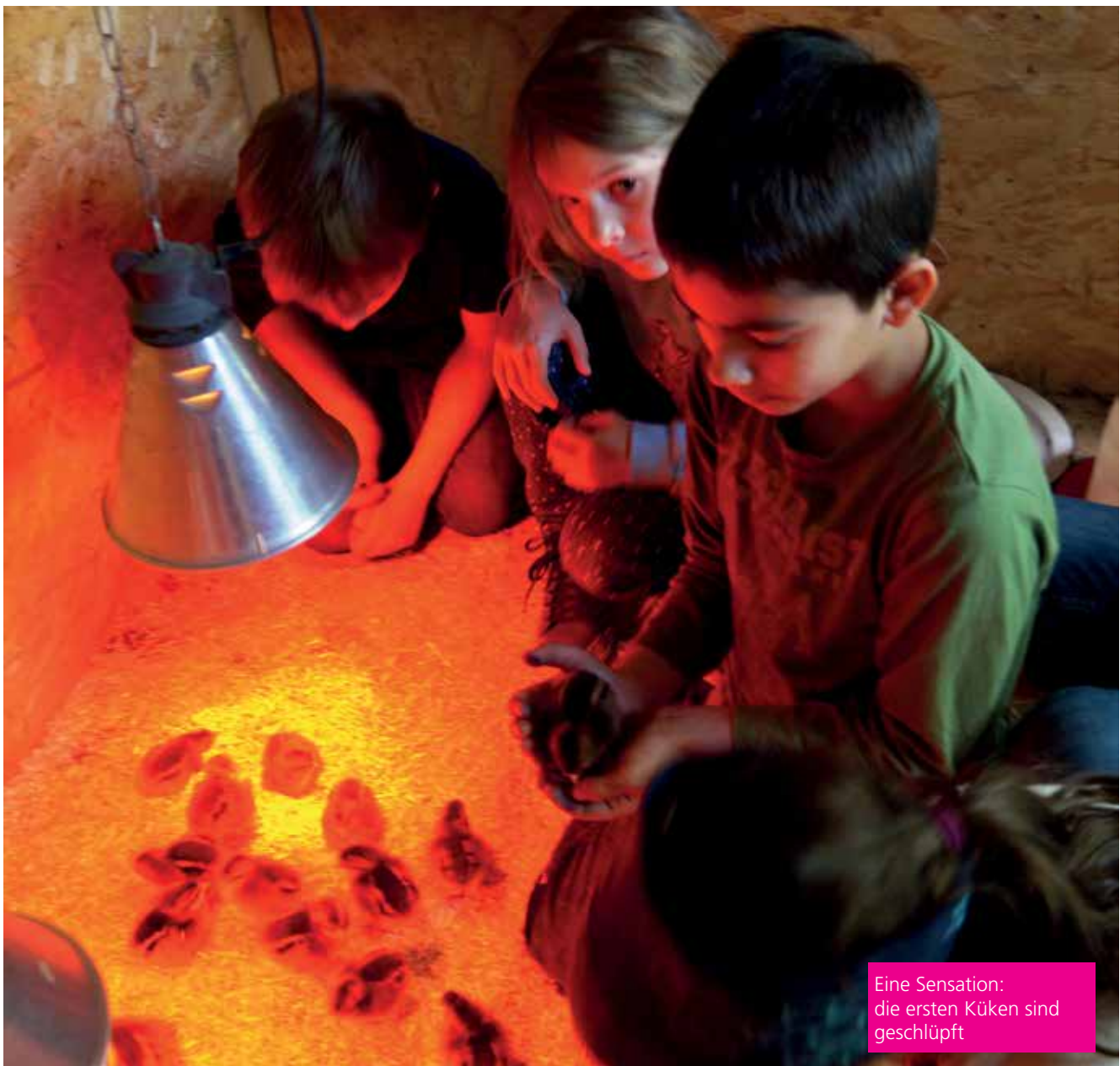
Eine Sensation: die ersten Küken sind geschlüpft