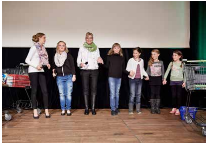
»Nicht wie unsere Mütter«: Die Powergirls hatten einen Sketch einstudiert